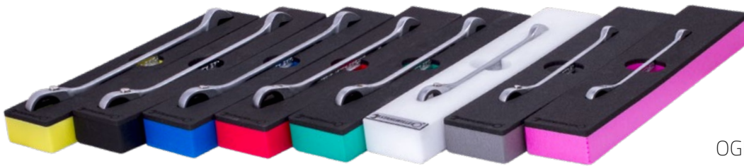
TCS-1 TCS-2 TCS-3 TCS-4 TCS-5 TCS-6 TCS-7 TCS-8

Możliwość produkcji i dostaw modułów TCS w dowolnych wymiarach dla indywidualnie zaprojektowanych zestawów narzędzi do dowolnych mebli warsztatowych.