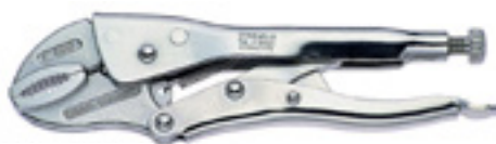
6564 Szczypce zaciskowe z obcinakiem do drutu