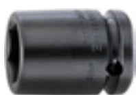
50 Nasadka 1/2" IMPACT, 6-kątna, krótka

Sprawdzone narzędzia stworzone specjalnie do wkrętarek elektrycznych i pneumatycznych. Wszystkie narzędzia z grupy produktów IMPACT zostały zaprojektowane do pracy pod dużym obciążeniem. Ich specjalne wykonanie gwarantuje nadzwyczajną wytrzymałość i długoletnią użyteczność w pracy z narzędziami udarowymi. IMPACT jest uosobieniem najwyższej jakości narzędzi wykonanych przez profesjonalistów dla profesjonalistów.