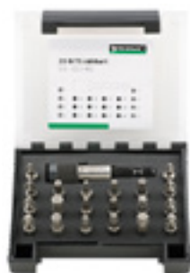
1204 Zestaw końcówek typu BIT