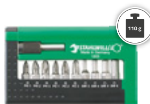
1203 Bity w skrzynce 11-elementów