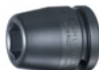
55 IMP Nasadka 3/4" IMPACT, 6-kąt, krótka