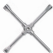
34 C, 35 C Klucz krzyżakowy do kół