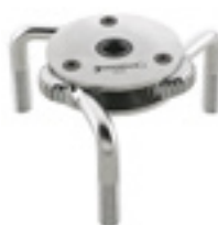
1015 Klucz do filtra oleju 3/8"