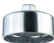
3045 Nasadka do filtra oleju