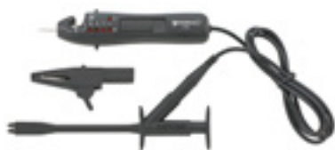
7756 Samochodowy próbnik napięcia w zestawie