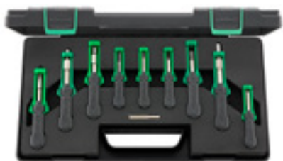
1700 MAN/Volvo Zestaw narzędzi KABELEX®