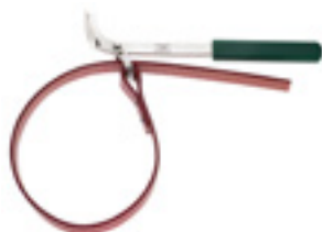
12005 Klucz paskowy do filtra oleju